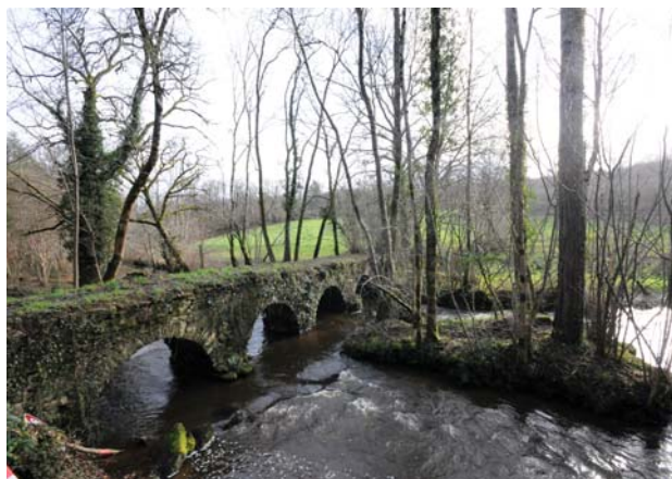
Le pont du Guédou

Les habitants de Berneuil sont appelés les Berneuillais et les Berneuillaises.