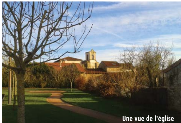
Une vue de l'église

7 Arrivé à un chemin, tourner à droite et remonter vers la RN147. A la route, la suivre à droite puis traverser pour rejoindre la place de la mairie et le parking.