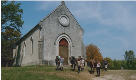
Photo de la chapelle de Vaulry